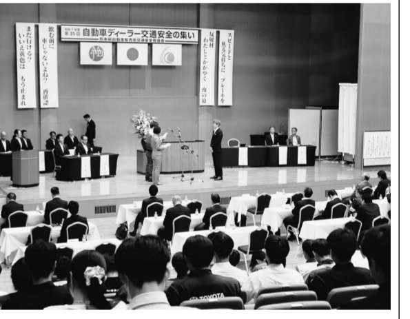
大会宣言で交通安全への意識を高めた