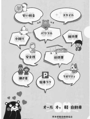
オールオッ軽自動車