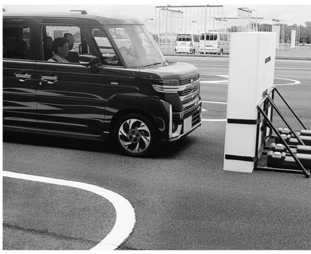
高年齢ドライバーによる事故が問題となる中、業界を挙げて事故防止に取り組もうと定期的に開催している。今年24日に第11回を開催した。衝突被害軽減ブレーキやペダル踏み間違い急発進抑制装置などが搭載されたサポカーを会員ディーラーが試乗車として準備。車の代替となるシニアカーなどの電動モビリティの体験乗車も行っている。