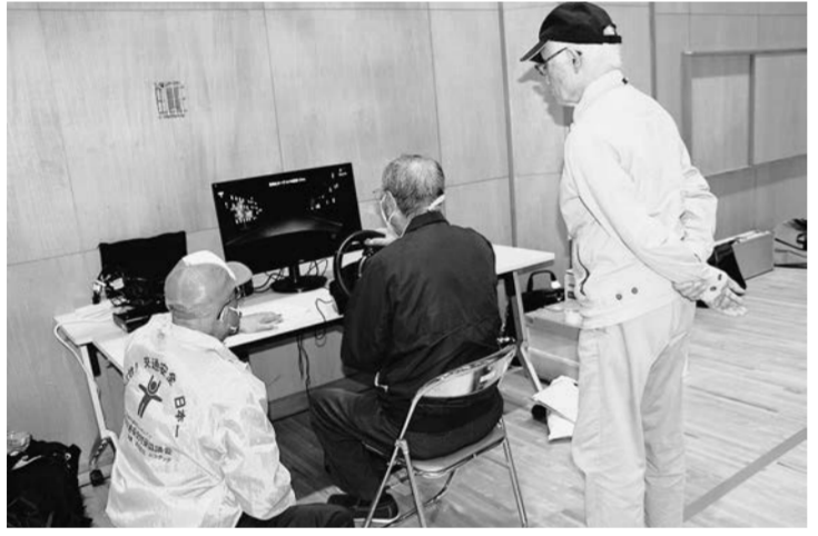
高齢者安全運転講習会の様子