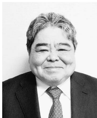
「M&Aや事業承継などの提案やマッチング支援などは、銀行系が動いているようだが、県内の整備業界においては、なかなか難しい環境にあるようだ。」「運輸局など行政によ

「人材不足は地域によって温度差があるのも特徴。例えばは津地区などは人材が減少の一途をたどり、連動してメカニックの高齢化も急速に進行