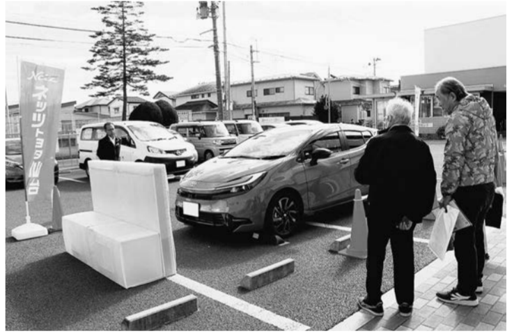
サポカー体験会も各地で開催されている

警察庁の発表によると、2025年に全国で運転免許証が自主返納された件数は、2連続増の43万5067件だった。うち75歳以上の返納は26万9155件で、全体の約6割を占めた。また、運転経歴証明書の交付件数は、29万7359件で、うち75歳以上が17万3744件となった。 そのうち、東北6県の自主返納件数は2万8550件で75歳以上は1万9443件。各県別では、青森が3657件、うち75歳以上2048件、岩手が4043件、宮城が4740件、同2927件、秋田が2341件、同1635件、山形が2695件、同2086件、福島が4243件、同3120件だった。