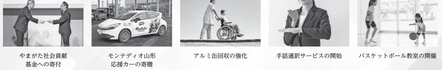
やまがた社会貢献基金への寄付 | モンテディオ山形応援カーの寄贈 | アルミ缶回収の強化 | 手話通訳サービスの開始 | バスケットボール教室の開催