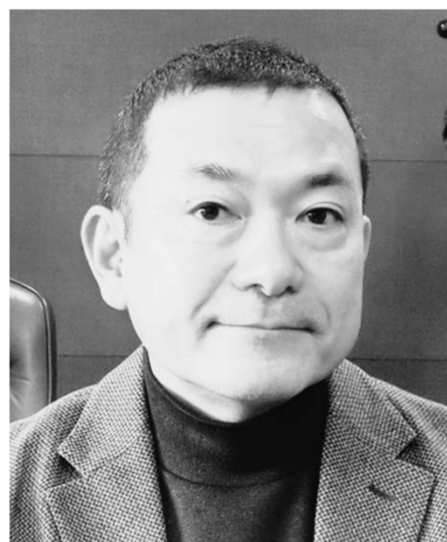
小中学生から行う必要がある。アプローチは先の就職活動におけるインシニアが先生や保護者にあるという点は、この業界では、周囲の大人の理解度で勝負が決まるといえる。」「整備士に抱くネガティブイメージを払拭するには、自動車関連業界団体、自動車メーカー、ディーラーが先生や保護者に正しい情報を発信することが大切だ。そうした意味でも、ジュニア

「クルマ好きの子どもや若者がこれほどまでにいるのだと改めて実感した。」「高校生にアプローチしても遅く、それこそ整備士を志望しない