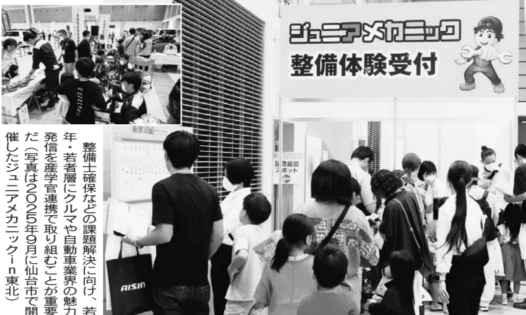
整備士確保などの課題解決に向け、若年・若者層にクルマや自動車業界の魅力発信を産学官連携で取り組むことが重要だ(写真は2025年9月に仙台市で開催したジュニアメカニックin東北)