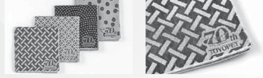
「米織小紋」のハンカチ