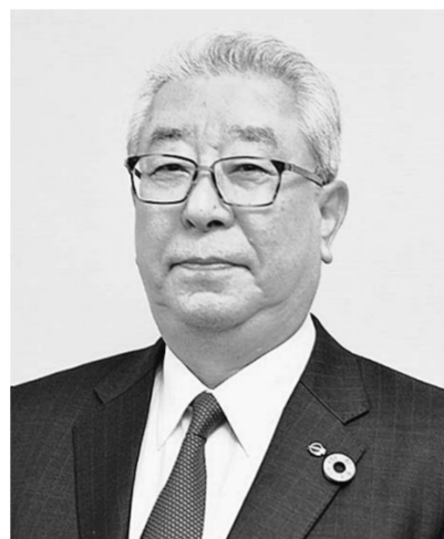
強化し、事業協力を進めていくことも一つの方法から期待、信頼され、これに必要の活動を続けてきているということ。」「整備士も増えている。」「働きたいという理由で土日日出勤して働いてほしいという整備士もいる。」「事業者は整備士の待遇改善や設備投資を行うには原資を増やす必要が

「クルマ好きの子どもの若者がこれほどまでにいるのだと改めて実感した。」「高校生にアプローチしても遅く、それこそ整備士を志望しない