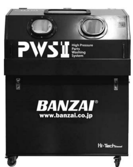
部品の頑固な汚れ洗浄に最適、省力化の高圧部品洗浄機

さらに、高圧洗浄機や車のコーティング・美装関連商品ブランド「BP RO」を展示し、自動車の美しさを保つために必要なアイテムを紹介する。高圧洗浄機の実際の動きを伝えるため、洗車体験コーナーを設ける。高圧部品洗浄機を展示する。