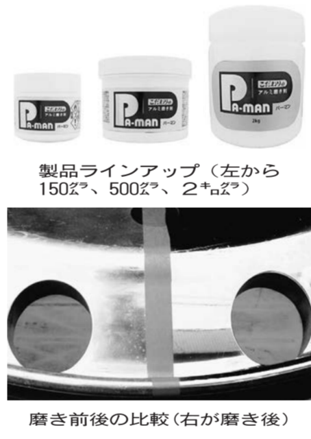
製品ラインアップ(左から 150㍉、500㍉、2+㍉)

しと光沢出しを目的とし た半練りタイプのポリッ シユ。同社の製品開発で 得た国内市場 のニーズと特 性を反映し、 既存海外製品 では実現でき なかつた光沢 性能と低臭を 兼ね備えるこ とで「お客さま まが抱してい る課題や不満 を解決できる 機能や性能を 盛り込んだ」としている。 アルミ磨き剤に求める 細かい使用感を実現する ため国内開発にこだわっ た。アルミホイール表面 への均等な塗布と深い光 沢感を得るためには、汚 れ落ち性能とポリッシユ 剤の伸び具合の両立が最 大の課題で、理想的なパ ランスで設計するため複 数の協力会社と度重なる 検討を行い、3度目の試 作で完成にこぎつけた。