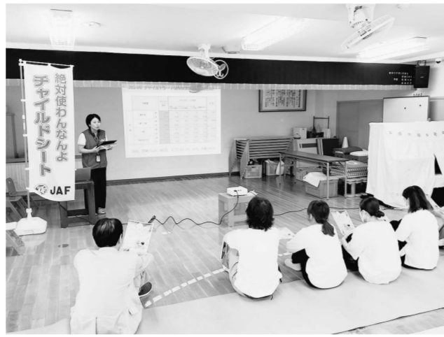
北陸地区でも日本自動車連盟（JAF）各支部がさまざまな交通安全対策を推進する

2024年の交通事故死者数は石川県が30件（前年対し2件増）、富山県が18558件（同20件減）、福井県が964件（同22件減）だった。確