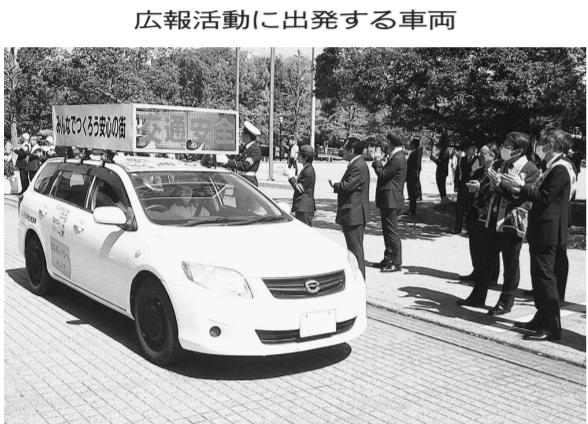
広報活動に出発する車両

浅野大介副知事は県内の交通事故死者に占める高齢者の割合が大きいかを強調し、「高齢者の事故防止が喫緊の課題。痛ましい事故を一件でも減らせるよう、交通ルールの順守徹底を県民の皆さまに呼び掛けてい