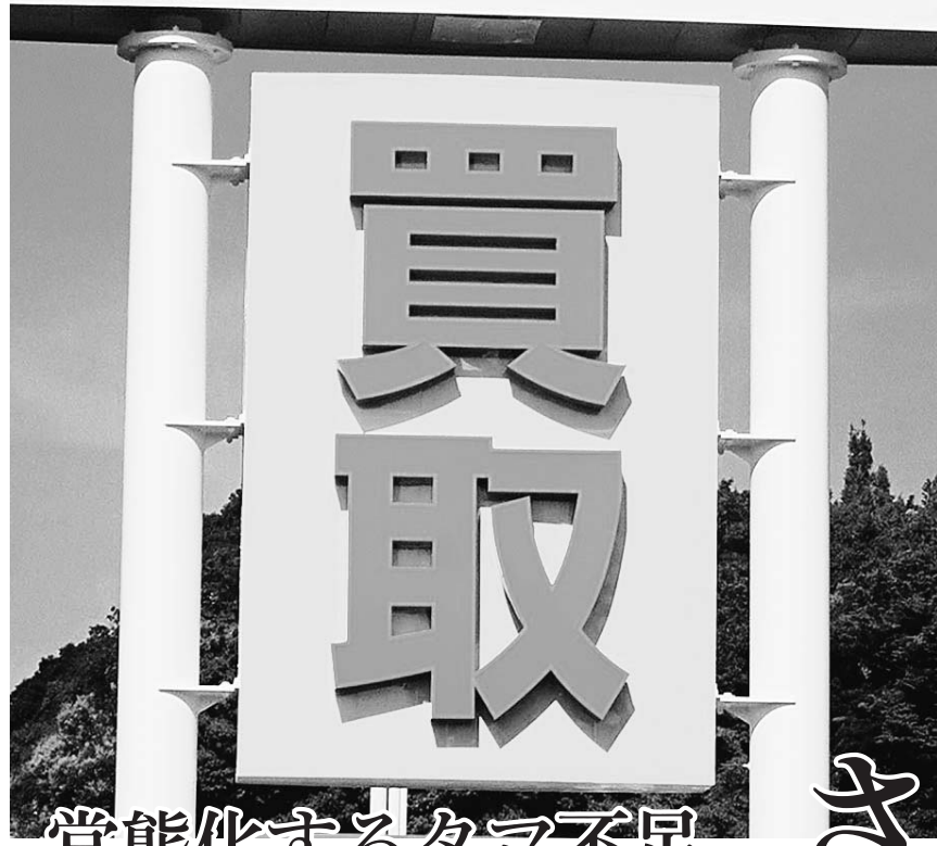
各事業者の買い取り能力が問われる