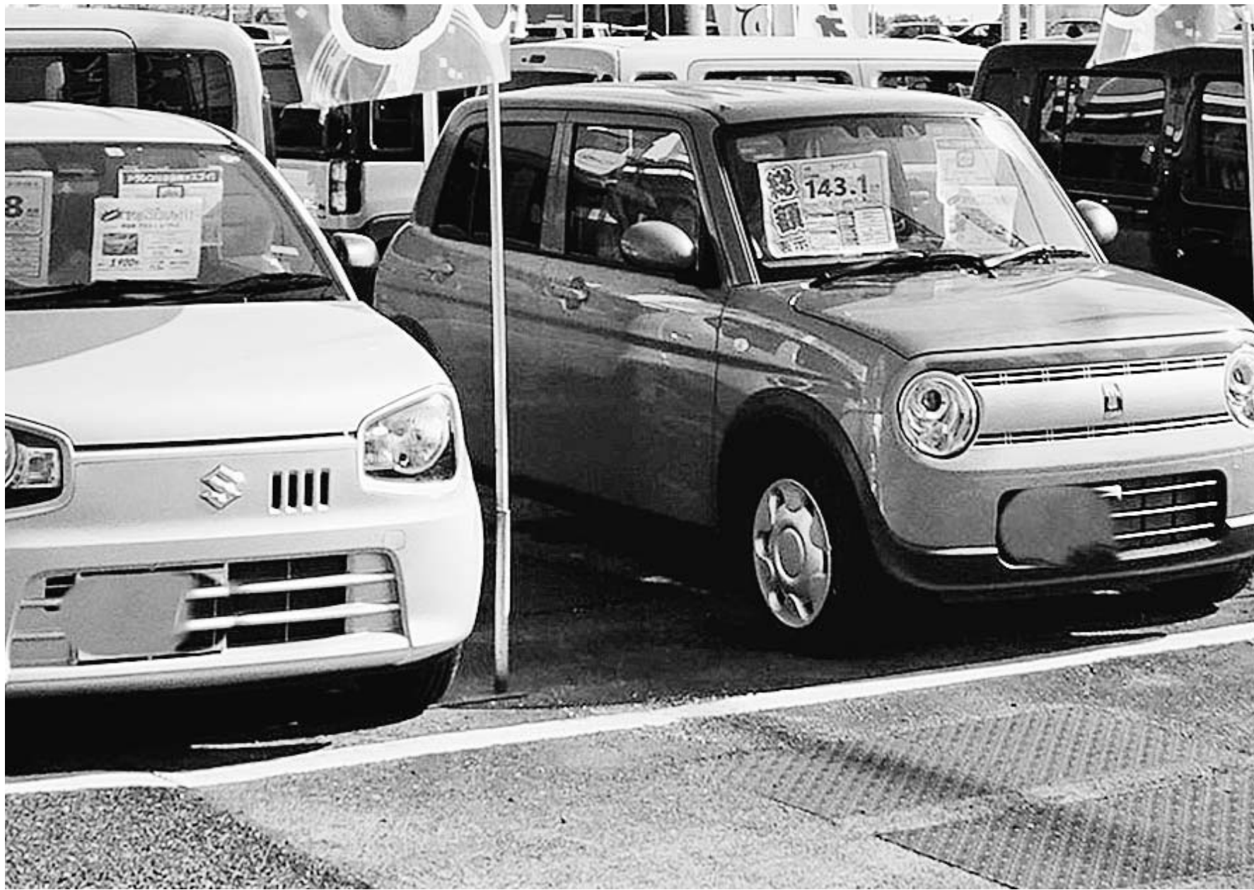
26年も小売りの需要は底堅い