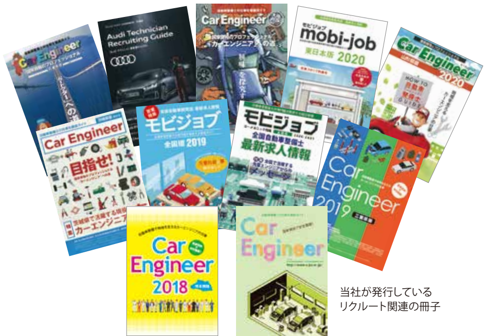
当社が発行しているリクルート関連の冊子