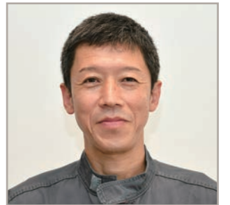
Audi練馬 フォアマン(工場長)

我が社の こが自慢です ●働きに対する適正な評価 ●豊富な社員コミュニケーション機会